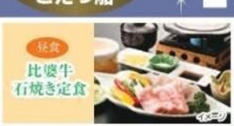
比婆牛石焼き定食