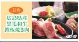
広島県産黒毛和牛鉄板焼き肉