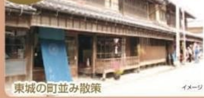
東城の町並み散策

東城町に400年以上続く、伝統ある文化行事をたっぷり見学。大名行列や迫力のある武者行列、かわいらしい華子さんの姿をご覧ください。