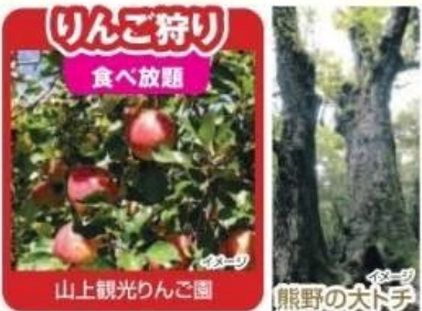
りんご狩り 食べ放題

比婆山の聖地として信仰を集めた熊野神社の社叢は、100本以上の老杉から成ります。中には樹齢が千年を超えるものもあり、そのうち11本が広島県の天然記念物に指定されています。神社を守るように数十年前の杉の大木が天に向かってそびえる様子は圧巻です。