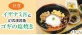
イザナミ井とゴギの塩焼き