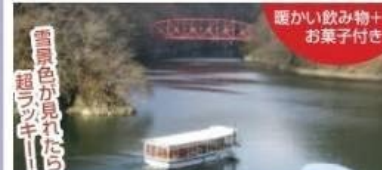
帝釈峡遊覧船 こたつ船